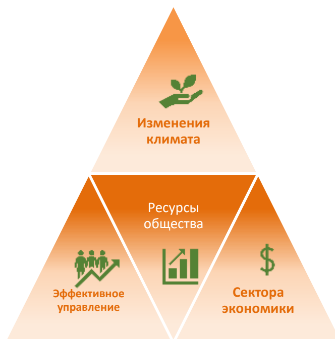
1-рисунок. Значение «зеленых» навыков. Разработка автора

Следует отметить, что понимание «зеленых навыков» не ограничивается узким экологическим контекстом. Эти навыки рассматриваются в более широкой перспективе, как ключевые компетенции, необходимые трудовым ресурсам в различных секторах экономики и на всех уровнях. Суть заключается в том, чтобы помочь адаптироваться к изменению климата, подстраиваясь под новые экологические требования к продукции, услугам и процессам (1-рисунок)..