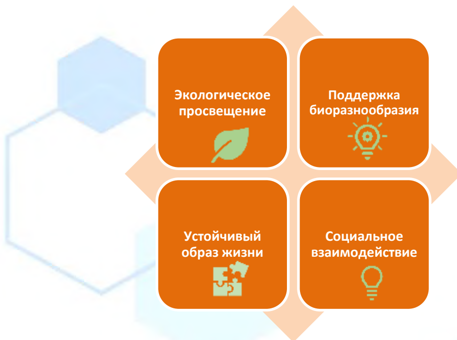
2-рисунок. Положительные факторы развития «зеленых» навыков.