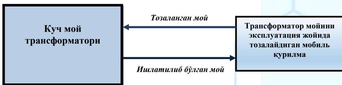
3-расм. Ишлатилиб бўлган трансформатор мойларини эксплуатация жойида циркуляция усулда тозалаш

3-расмда ишлатилиб бўлган трансформатор мойларини эксплуатация жойида циркуляция усулда тозалаш чизмаси келтирилган [2].