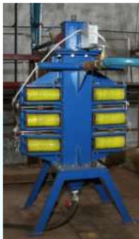
1-rasm. Faollashtirilgan suv olish apparati

kelib suvning va boshqa suyuqliklarning agregatlashtirmaydigan (nokimyoviy) yo'l bilan fizik-kimyoviy xossalarni o'zgartirish uchun usul va vositalar yaratilgan (1-rasm).