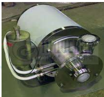
2-rasm. Rotorli-pulsatsiyalanuvchi apparat

Masalan, qorishmalar, betonlar va boshqa tsementli kompozitsiyalar uchun tsement suspenziyasini RPA da qisqa muddatli ishlov berilishi beton qorishmasining yuqori plastikligini saqlagan holda betonning tabiiy sharoitlarda qotishi muddatini 3 barobar qisqartiradi, buyumlarni issiqlik bilan ishlov berilishi davomiyligini 30...35 % ga kamaytiradi, tsement sarfini 25% gacha kamayishini yoki beton mustaxkamligining sezilarli oshirishini ta'minlaydi. RPA lardan loy suspenziyasini tayyorlashda foydalanish sopol g'isht yoki cherepitsaning fizik-mexanik xossalarini 1,5-2,0 barobar oshiradi, ularning tannarxini kamaytiradi va texnologik tsikl davomida vaqt va resurslarni tejash imkoniyatlarini beradi[4].