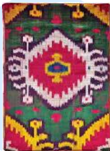
1-rasm. a'lo baxmal gazlamasi

Ayrim naqshlar o'zining ko'rinishiga nisbatan kattaroq nomga egadir. Bu jarayon mohir usta-hunarmandlarning yaratgan kompozitsiyalarida murakkab g'oyalarni kiritish demakdir. Bular natijasida ranglar uyg'unligi, naqshning shakli va asosiy g'oyaga erishiladi. Atlaslarda qo'llanilgan mashhur naqshlar: "G'alaba", "O'zbekiston", "Sputnik", "Kreml" va h.k.