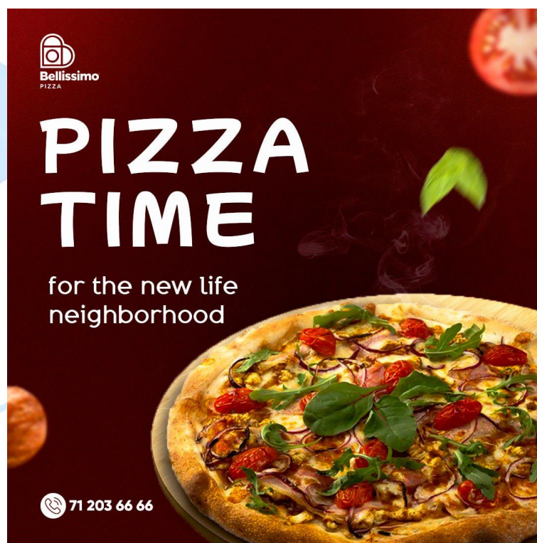
2-rasm Bellissimo pizza

(SMD) oziq-ovqat Bellissimo pizza uchun tayyorlangan post bo‘lganligini uchun oldingi fonga pitsani hajmi kattaroq qilib joylashiriladi va mavzuga mos matn yoziladi. Brend logotipi qulay ko‘rinadigan hajmda joylashtiriladi. Hozirgi 2,3 yil ichida O‘zbekistonda ingliz tili juda tez suratlarda rivojlanishi va ko‘p yoshlar ayna shu tilni o‘zlashtirishmoqda. Qolaversa bundan tashqari yoshlarimiz uchun bu tilda suhbat qurish uchun odatiy holga aylanmoqda. Shudan kelib chiqqan holda (SMD) uchun tayyorlangan postlarni ham ingliz tilida uchratishimiz mumkin. Qolaversa, hozirgi kunda tashqi reklamalar ham aynan ingliz tilida yozilayotganiga guvohi bo‘lmoqdamiz.