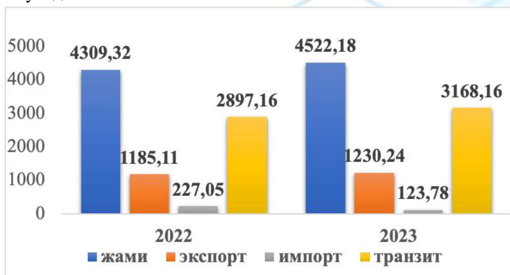
5-расм. Трансафғон транспорт коридори орқали темир йўлда ташилган юклар ҳажми (минг тонна)

Шу билан бирга, Хитой ва Ўзбекистон темир йўллари Қирғизистон орқали боғламай туриб, таклиф этилаётган Мозори Шариф-Ҳирот темир йўлининг Қозоғистон-Туркменистон-Эрон темир йўли билан рақобатлашиши жуда қийин бўлади.