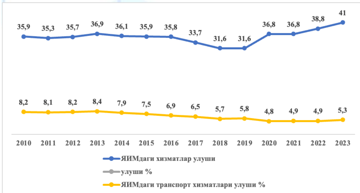
1-расм. Ўзбекистон Республикаси ЯИМда транспорт хизматлари улуши 2010-2023 йилларда

Мамлакат ялпи ички маҳсулотида хизматлар етакчи ўринни эгаллаб, 2023 йилда уларнинг улуши 41 фоизни ташкил қилган. (1-жадвал).