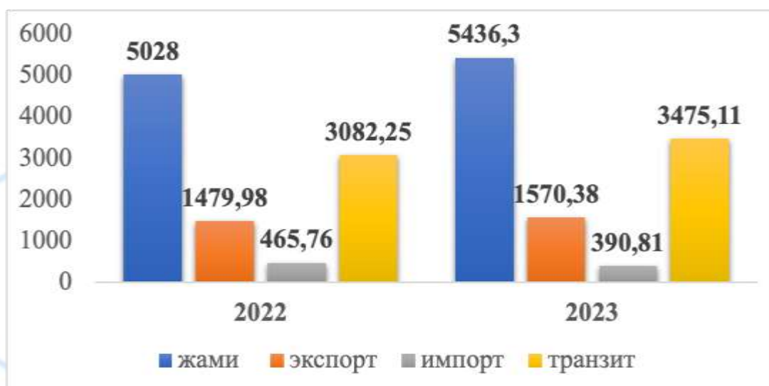
4-расм. Трансафғон транспорт коридори орқали ташилган юклар ҳажми (минг тонна)

Ушбу ташилган юкларнинг 2022 йилда 4 309,32 минг тоннаси, 2023 йилда 4 522,18 минг тоннаси темир йўл орқали ташилган (5-расм).