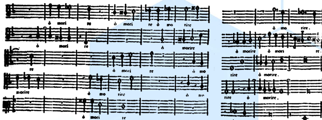
2 súwret. Dolcissima mia vita madrigalıńıń aqırǵı taktleri.

Madrigal kúshli poziciyasidan, joqarı registrdan baslanıp, pútkil taktte dawam etetuǵın, tolıq B-dur daǵı úshseslikten baslanıp, kúshsiz hám hálsiz poziciyaǵa keledi, sońǵı akkord, G-dur tonlıǵındaǵı úshseslik penen, hátte metrik kúshsiz úleste juwmaqlanadı(tórtinshi úleste) (2 súwret).