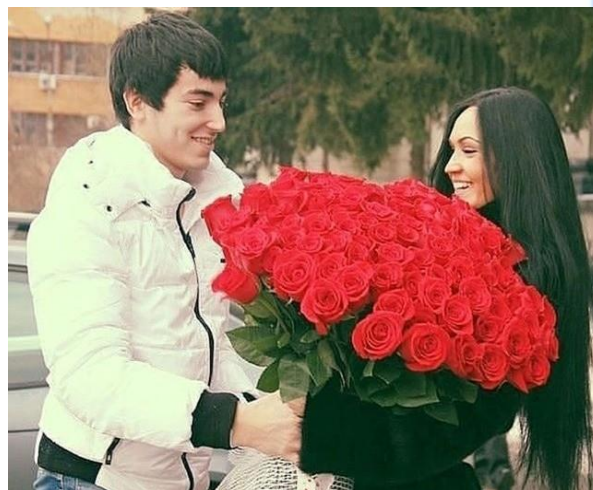
21 mars - Navruz

L'ancienne fête nationale de Navruz (« fête de Navruz ») signifie « nouveau jour » lorsqu'elle est traduite du persan. Navruz est célébré le 21 mars et marque le début de la nouvelle année. Ce jour est l'équinoxe. La Terre entre dans la période de l'équinoxe astronomique. Aussi, durant cette période, les saisons de l'année changent selon l'hémisphère, si l'automne arrive dans l'hémisphère sud, et le printemps dans l'hémisphère nord. Cette fête est célébrée lorsque toutes les plantes et tous les arbres sont en fleurs et lorsque le printemps arrive. Avec l'arrivée de cette fête, de nombreuses familles ouzbèkes préparent divers plats nationaux : Sumalak, Halim, Kok somsa, Osh et autres. Ces aliments sont riches en nombreuses vitamines utiles pour le corps humain. Après l'indépendance de notre pays, les anciennes coutumes et traditions de notre peuple sont entrées en vigueur, y compris la célébration de Navroz, qui a acquis un caractère particulier. Cette fête est une fête nationale qui est un symbole d'amitié et d'unité de tous les peuples.