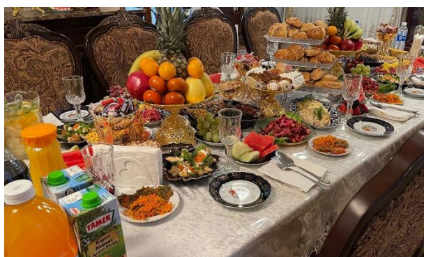
14 janvier - Journée du Défenseur de la Patrie

En Ouzbékistan indépendant, cette fête est dédiée à l'organisation des forces armées. Le 14 janvier 1992, le Parlement du pays a adopté la décision de transférer toutes les parties et associations des établissements d'enseignement militaire et autres formations militaires sur le territoire du pays sous la juridiction de la République d'Ouzbékistan. C'est ainsi que furent créées des forces armées privées. Le 29 décembre 1993, le 14 janvier fut proclamé Journée des défenseurs de la patrie.