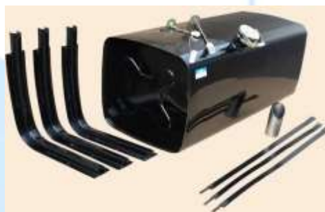
1-rasm. Dizel yoqilg'isini saqlovchi bak turlari.

Yoqilg'i baki yonuvchan suyuqliklarni saqlash va ularni ishchi qurilmaga yetkazib berish uchun mo'ljallangan. Ushbu konstruksiya, bakga yetkazib beriladigan suyuqlik bosimidan hosil bo'lgan statik yuklanishlar sharoitida ishlaydi.