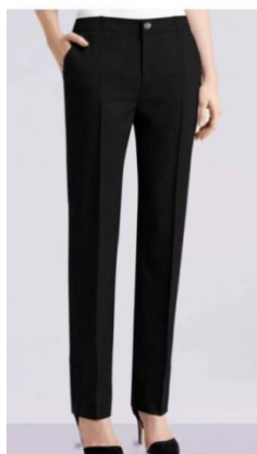
Ayollar uchun klassik chiziqlar

-oqlar tasvirga qo'shimcha yorqinroq va murakkablik baxsh etadi, ular chindan ham befarq bo'lmagan qattiq ofis materiali yaratish uchun ishlatilishi mumkin.