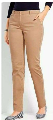
Ayollar klassik ingichka shim

-mahsulot engil yoki yopishqoq matodan tayyorlanishi mumkin, paxta, ipak, tukli, korduroy va boshqa matolarni ishlab chiqarish uchun material sifatida ishlatiladi.