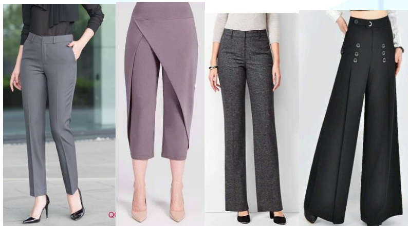
Ayollar shimi modellari

Jinsi shim ishga va dam olishga juda qulay. Ularning modellari juda xilma-xil: bushimlar bel chizigʻidan, undan yuqoriroqdan yoki pastroqdan oʻtadigan belbogʻli, qirqma koketkali, qoplama choʻntakli yoki shimning old boʻlagi choklarida choʻntaklar boʻlishni mumkin. Jinsi shimlarning bezagi baxya qatordan, taxlamalar, mayda taxlamalardan yoki gazlama boʻyiga bichilgan parchalardan oʻrilgan tasmalardan iborat boʻlishi mumkin. oʻsmirlar uchun moʻljallangan yubka-shimlar yoki kombenzon juda qulay.