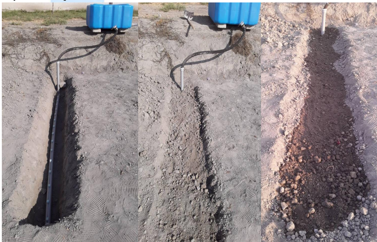
1-rasm. Tuproq ostida Namlab sug'orilgan joyning ko'ndalang kesmi.

Yuqoridagi tahlillar va olib borilayotgan ilmiy tadqiqot va laboratoriya sharoitidagi tajribalar tuproq osidan sug'orish yaxshi natija ko'rsatishi va o'simliklarning o'z me'yorida suv bilan to'yintirilishi quyidagi keltirilgan tajribalar jarayonida aniqlandi.