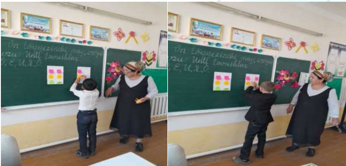
1-rasm. Dars jarayonidan lavha

Darslarni o'tish jarayoni o'quvchi va o'qituvchi o'rtasidagi aloqa bilan yaratiladi, an'anaviy dars - ko'p hollarda ta'lim jarayoning birdan-bir modeli bo'lib qo'lmoqda. An'anaviy dars – passiv dars berish usuli bo'lib, darsning samaraliligi uni rejalashtirilishiga bog'liq bo'ladi. Ma'lumki an'anaviy darsda ta'lim jarayonining markazida o'qituvchi turadi. An'anaviy dars o'tish modelida ko'proq ma'ruza, savol-javob, amaliy mashq kabi metodlardan foydalaniladi. Shu sabab an'anaviy dars samaradorligi ancha past bo'lib, o'quvchilar ta'lim jarayonining passiv ishtirokchilariga aylanib qoladilar. Dars rivojlanishining asosiy tendensiyalari darsga bo'lgan talablarda o'zining aniq ifodasini topadi.