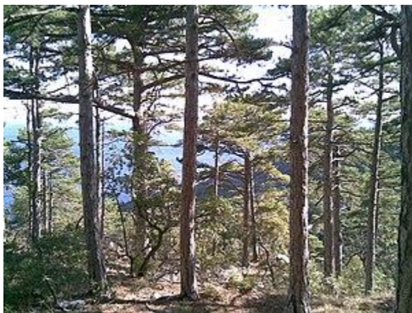
Qrim qarag'ay o'rmoni