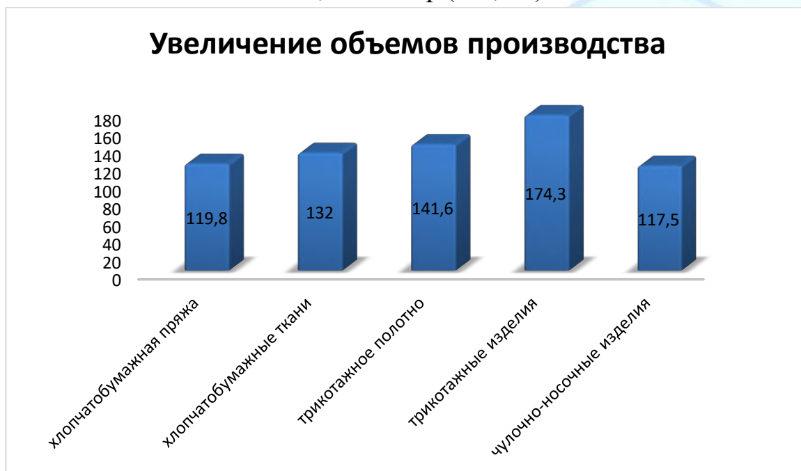
Рисунок 2. Увеличение объемов производства текстильной продукции за 2023 год

Данное Постановление Президента уже дало свои результаты на конец текущего 2023 года относительно 2020 года в виде увеличения объемов производства хлопчатобумажной пряжи до 932,0 тыс. тонн (темп роста 119,8%), тканей хлопчатобумажных – 930,0 млн. кв. м (132%), трикотажного полотна – 275,0 тыс. тонн (141,6%), трикотажных изделий — 2650,0 млн. штук (174,3%), чулочно-носочных изделий — 470,0 млн. пар (117,5%).