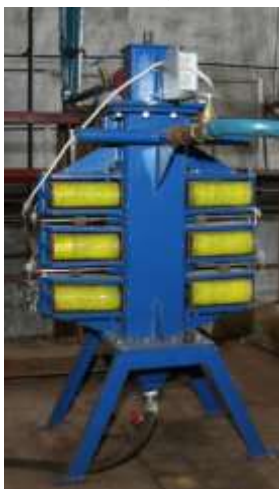
Рисунок 1. Активированный водозаборный аппарат

воды (несколько нм) производство и использование структурированной воды можно отнести к семейству нанотехнологий. К настоящему времени созданы методы и средства изменения физико-химических свойств воды и других жидкостей неагрегирующим (нехимическим) способом (рис. 1).