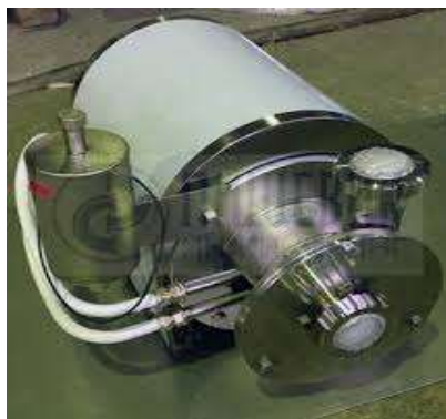
Рисунок 2. Роторно-пульсирующее устройство

Например, кратковременная обработка цементной суспензии в РПА для смесей, бетонов и других вяжущих составов, сохраняя при этом высокую пластичность бетонной смеси, сокращает период твердения бетона в естественных условиях в 3 раза, сокращает продолжительность нагревания. обработка изделий на 30...35 %, расхода цемента обеспечивает снижение до 25 % или значительное увеличение прочности бетона. Использование РПА при приготовлении глиняной суспензии повышает физико-механические свойства керамического кирпича или черепицы в 1,5-2,0 раза, снижает их стоимость и дает возможность сэкономить время и ресурсы в ходе технологического цикла [4].