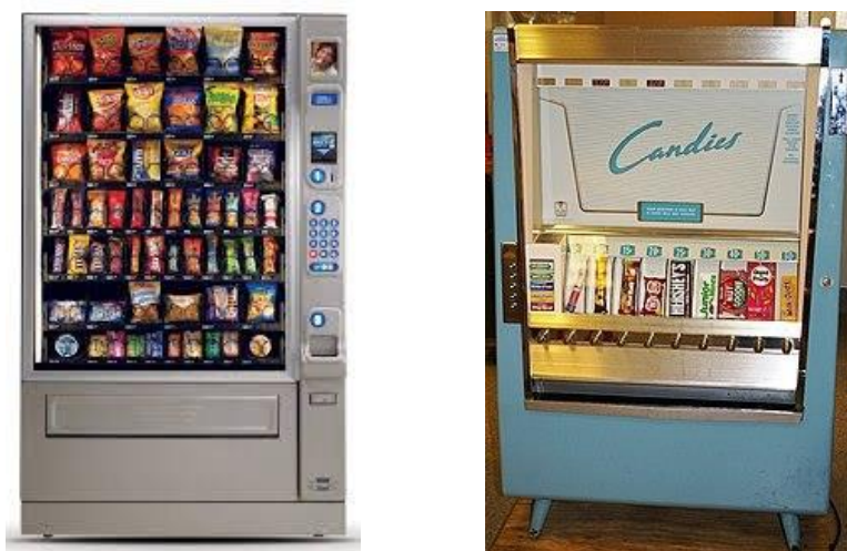
1-rasm. 1952-yilda ishlab chiqarilgan gazak-ovqatlar avtomati

ma'noni anglatadi. Bu avtomatlashtirilgan avtomat bo'lib, iste'molchilarga gazaklar, ichimliklar va lotoreya chiptalari kabi mahsulotlarni naqd pul, kredit karta va boshqa to'lov shakllari mashinaga kiritilgandan yoki boshqa tarzda amalga oshirilgan so'ng beradi.