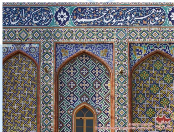
2-rasm. Handasaviy va islmiy naqshlar

Islomiy naqsh – tabiatda uchraydigan gullar, barglar, g'uncha, novda va tanoblardan foydalanib, tuzilgan o'simliksimon ramziy naqsh kompozitsiyasiga aytiladi. Islmiy naqshlar ona tabiat, tabiatning go'zalligi noz ne'matar diyori ekanligi, tolqinsimon islmiy naqsh hayotning notekisligini, o'ning o'n beshi yorug' bo'lsa o'n