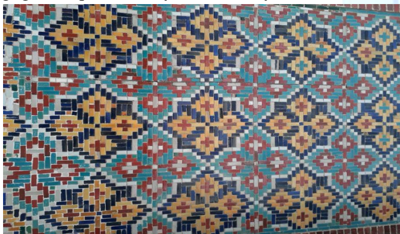
3-rasm Grih handasaviy naqsh

Grih (fors. – muammo, tugun, chigal) – murakkab handasiy naqsh, me`morchilik va badiiy hunarmandchilikda keng ishlatiladi. Naqsh asosi uchburchak, to`rtburchak murabba, aylana va yoy shakllaridan tashkil topadi. Handasiy jihatdan grihni tahlil etish, chizib chiqish, yangi turarini ijod etish maxsus tayyorgarlik va mahoratni talab qiladi. Grihlar yaratilish davrida soda bo`lib, keyinchalik takomillashib, murakkablashib borgan. Grih qanchalik murakkablashib mujassamotga ega bo`lmasin uning qulay tomoni ham bor. Har qanday grih takrorlanuvchi ma`lum bo`laklarga ajratiladi. Taqsimlar takrorlangan sari, go`zal va jozibali bo`lib boradi. Shu tufayli ba`zi soda grihlardan tashkil topgan murakkab grihni qayta parchalab, bir necha soda va mustaqil grih yasash, ikkinchi grihni bir-biriga chatishtirib, uchinchi hil grih yaratish mumkin. Shakllarga qarab grihlar turlicha nomlanadi. Taqsim asosida 5 va 10 qirrali yulduz bo`lsa, 5 va 10 qirrali grih pargar yordamida chizilgan egri. Aynan shunday shakldagi grih naqshni Xudoyorhon muzeyida ko`rish mumkin.