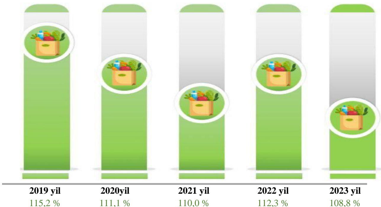
1-rasm. O‘tgan yilning dekabriga nisbatan INI

INIning shakllantirishga “Iste‘mol narxlari indeksi bo‘yicha qo‘llanma: Nazariya va amaliyot” (XVJ, IHRT, YHSB (Yevrostat), BMT, YIK, Butunjahon banki va XMT) tavsiyalarini hisobga olgan holda ishlab chiqilgan. Hozirgi kunda ushbu ko‘rsatkich tanlanma kuzatuv asosida mamlakatimiz hududlarida O‘zbekiston Respublikasi Prezidenti huzuridagi Statistika agentligi tomonidan hisoblab boriladi va ochiq ma‘lumotlar portali orqali keng ommaga e‘lon qilib boriladi.