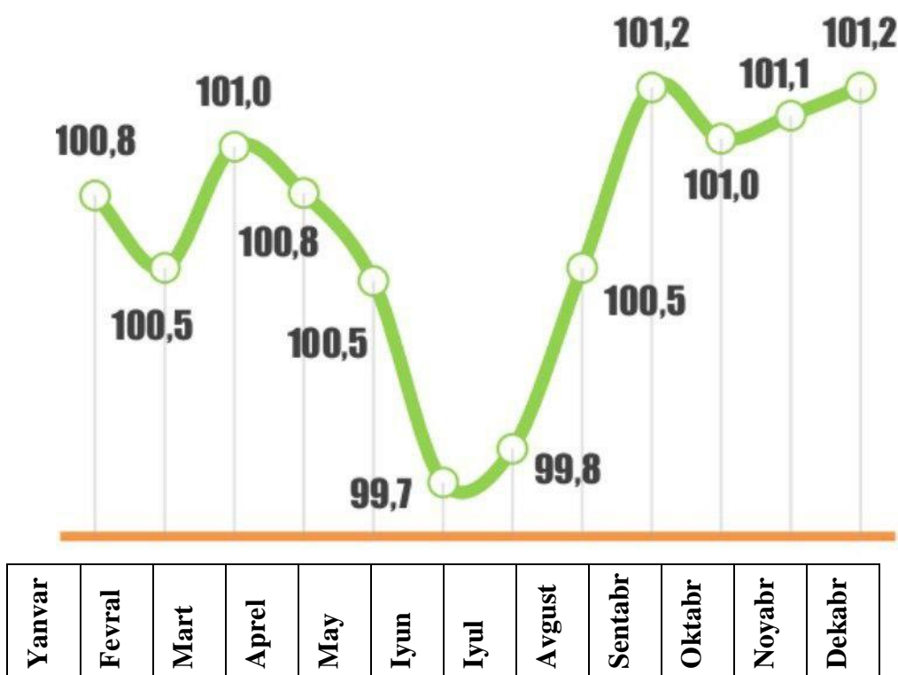
2-rasm. 2023 yil davomidagi qisqa muddatli yig‘ma INI qo‘shimcha o‘shish (pasayish) sur‘atlarining o‘rtacha oylik qo‘shimcha o‘shish sur‘ati bilan taqqoslamasi.

2023- yilda yig‘ma INI o‘rtacha oylik qo‘shimcha o‘shish sur‘ati 0,7 % ni tashkil etib, so‘nggi besh yillikdagi minimumiga tushganini kuzatishimiz mumkin. Xususan 2022- yilning mos davriga nisbatan 0,3 foiz bandiga pastroq bo‘ldi.