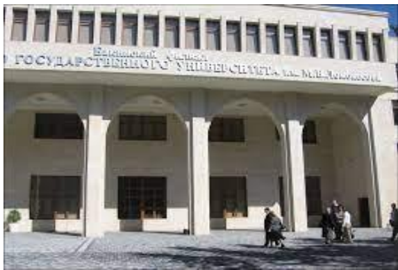
Bokudagi MDU filiali