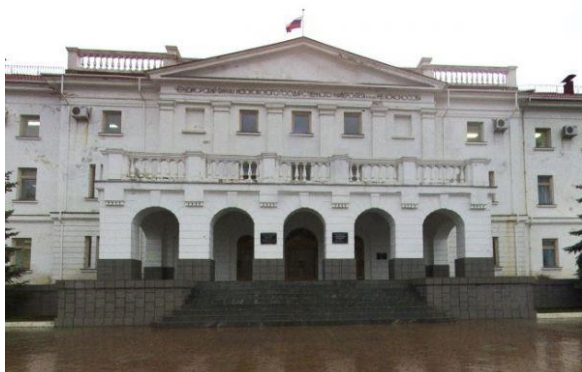
Sevastopoldagi MDU filiali