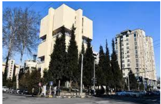
Dushanbedagi MDU filiali