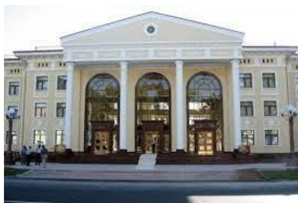
Toshkentdagi MDU filiali