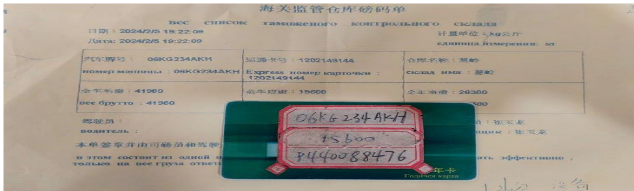
2-расм. Хитой давлатида чиқиш божхона постида махсус картани ўқитиш орқали олинган тарози маълумотлари.