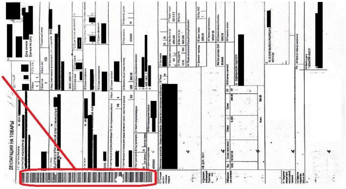
3-расм. Қирғизистон Республикаси транзит декларациясидаги махсус штрих код.

Қирғизистон Республикасида бир божхона постида назоратга қўйилган транзит декларация қоғоз нусхаси транспорт воситаси ҳайдовчисига чиқариб берилади. Қирғизистон транзит декларациясининг чап томонида махсус штрих код мавжуд бўлиб, назоратга қўйилган транспорт воситалари чиқиш божхона постида махсус аппарат ёрдамида штрих кодни ўқитиш орқали амалга оширилади ва транспорт воситасини чиқиш божхона постига етиб келганлиги шу орқали қайд этилади. Юқоридаги амаллар учун бор йўғи 2-5 дақиқа вақт сарф этилади. 3-расм