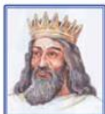
Solomon (Sulaymon) – Isroil – Yahudiy podsholigining hukmdori