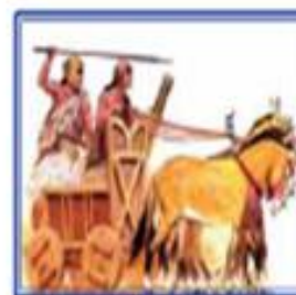
Xettlar jang oldidan