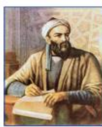
Abu Rayhon Beruniy