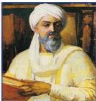
Abu Ali ibn Sino