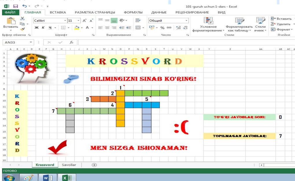
2-rasm. Krasswordni to'ldirishdan oldingi holat

- Innovatsoin krasswordlardan boshlang'ich ta'limning har bir bosqichida, shuningdek, yuqori sinflar dars jarayonlarida ham foydalanish mumkin. Microsoft Excell dasturida tayyorlangan krasswordni bajarishdan oldin o'quvchilarni krasswordni bajarishga undovchi fikrlarni keltirish va bu orqali ularning qiziqishlarini yanada oshirish mumkin.