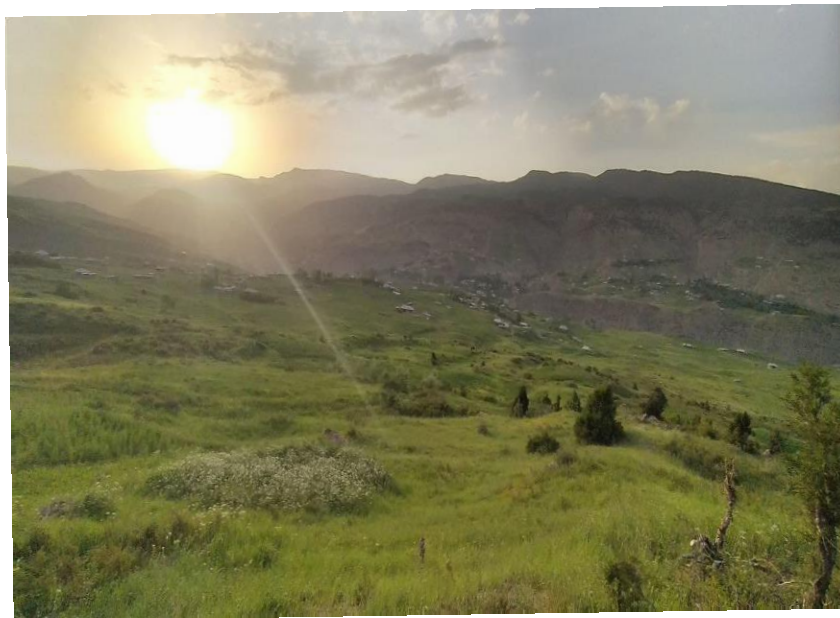
2-rasm .Qo‘shqul qishlog‘ining Geografik joylashuvi shimoliy va g‘arbiy qismi

Noqulayligi: uzumchilik va paxta pishmaydi haroratlar yig‘indisi kam va o‘rtacha tog‘ tizmalari va tog‘ oralig‘idagi daryo bo‘ylarida olmachilik uchun