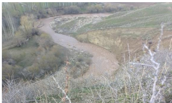
3-rasm . Katta Urta daryosi 2023 yilning 23 mart holati