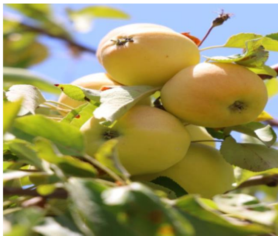
1-rasm to'g' olmasining ko'rinishi.

Quyoshli kunlar soni 170-210 kun Quyosh radiatsiya to'g'ri tushadi, dehqonchilik rivojlangan kartoshka, sabzavot,naxo't,qand lavlagi, sabzi, kungaboqar,bug'doy, arpa, poliz ekinlari bog'dorchilik,olma,shaftoli, o'rik,gilos, bo'g'dorchilik salqin joyda yaxshi rivojlanadi.