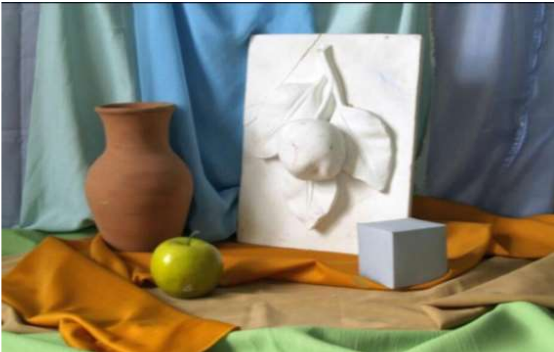
Gipsli natyurmort qo'yilmasi.

chizig'ining qanday holda turishi chiziqli konstruktiv usulda bajariladi. Avvalo tasvirlangan ikki qismli zanjir elementi aniqlanadi. Buning uchun zanjiraning gips taxtasidagi eng yuqori va pastki qismi hamda chekka nuqtalari belgilanadi. Ma'lumki, ushbu rozetkaning tomonlari, burchak graduslari bir-biriga teng va simmetrik. Shuning uchun uni teng ikkiga bo'lib o'tuvchi nuqtalardan gorizontaal va vertikal to'g'ri chiziqlar o'tkaziladi, o'tkazilgan vertikal ikki chiziq bir-biriga parallel bo'lsa, gorizontaal chiziq ganch taxtasining yuqori va pastki gorizontaal qirralariga parallel bo'lmagan holda o'z holicha o'tadi. Chunki, bu ikki to'g'ri chiziq talaba qaysi nuqtadan turib tasvirlayotganiga qarab perspektiv qisqarib boradi va ma'lum masofaga borib bir nuqtada uchrashadi (kesishadi). So'ng panjaraning qalinliklari belgilanadi va ular to'g'ri chiziqlar orqali birlashtiriladi.