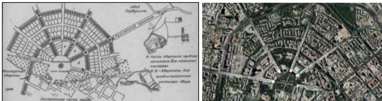
1-расм. Янги шаҳарнинг радиал – ҳалқасимон қисми. (чапда 1874 йил, ўнгда 2023 йил).

схемадаги лойихасини тузди (ҳозирги Шахрисабз ва Амир Темур шоҳкўчалари оралиғи) (1-расм).