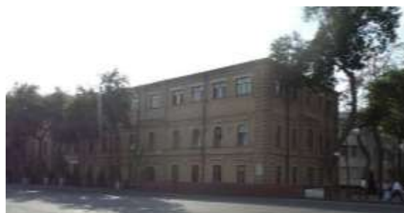
7-расм. Эркаклар ва аёллар гимназияси кўринишлари (тепада 1913, пастда 2023 йил)

Рус-Осиё банки “ака-ука Яушевлар савдо уйи” ўтиш жойи номи билан ҳам боғлиқ. Меъмор И.А.Маркевич лойиҳасига асосан 1910-йил Д.И.Захо уйи (Зарафшон рестарани) га параллел равишда қурилган. Ҳозирда савдо маркази сафатида фойдаланилади (8-расм).