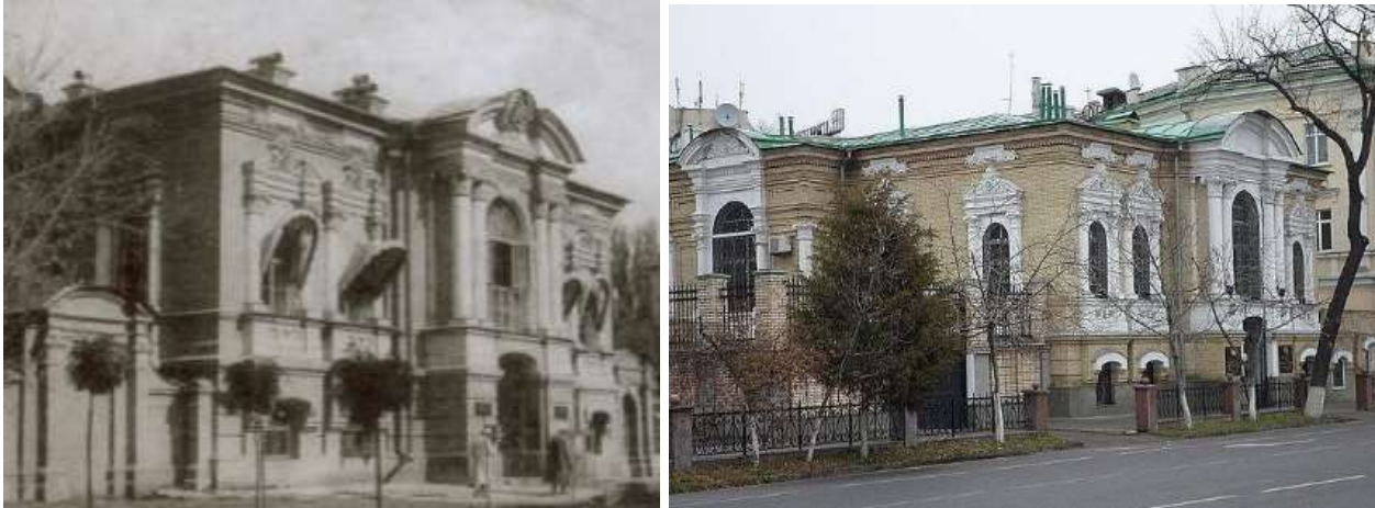
5-расм. Давлат банки кўринишлари. (чапда 1895, ўнгда 2019 йил)

Давлат банки 1895-йил меъмор В.С.Гейнцельман лойихаси бўйича қурилган. Дастлаб у Россия давлат банкининг минтақавий филиали бўлган, ҳозирда Ўзсаноат қурилиш банкининг филиали мавжуд (5-расм).