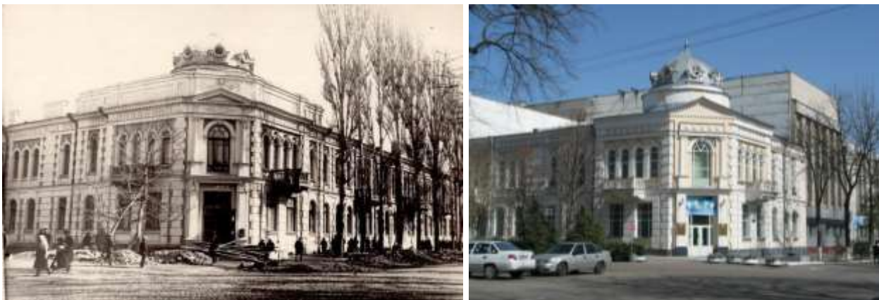
6-расм. «Националь» меҳмонханаси кўринишлари. (чапда XX аср, ўнгда 2019 йил)

«Националь» меҳмонхонаси 1912 йил меъмор И.А.Маркевич лойихаси асосида қурилган. Кейинчалик «Шарқ» меҳмонхонаси номи билан номланган. Ҳозирги кунда Нурунийлар ва Бухоро кўчалари кесишмасида жойлашган бу бинонинг сақланиб қолган қисмида «Нурунийлар» жамғармаси Тошкент шаҳар бўлими ўз фаолиятини олиб бормоқда (6-расм).