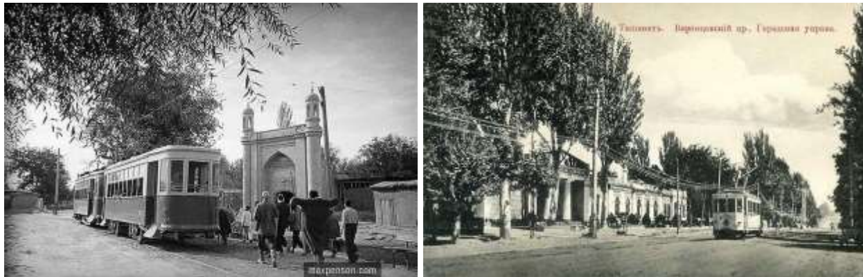
3-расм. Шаҳардаги трамвай йўли.

Маданий муассасалардан кишки ва ёзги театр, ҳарбий ва жамоат мажлислари бинолари, йўлчалар ва кўприклар қурилди. Катта кўчалар тунда керосин чироқлар билан ёритилар, кўчаларнинг четларига дарахтлар ўтказилиб, ободонлаштириш ишлари олиб борилди. Октябрь тўнтаришига қадар бажарилган шаҳар ободончилигига доир ишлардан энг йириги “кўнка” трамвай қурилиши бўлган (3-расм).