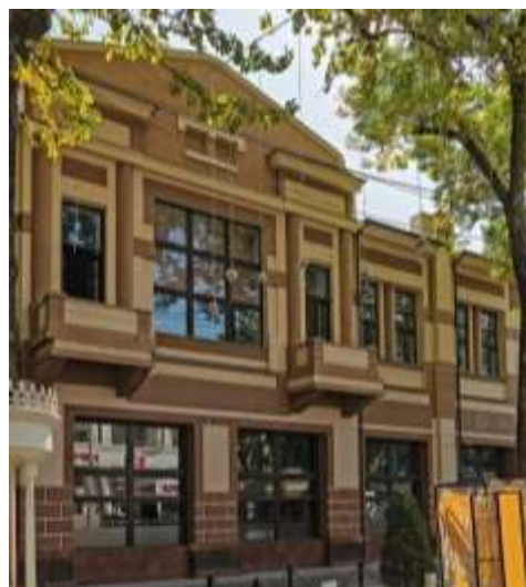
8-расм. Рус-Осиё банки кўринишлари. (чапда XX аср, ўнгда 2019 йил)

“Регина” меҳмонхона меъмор Г.М.Сваричевский лойиҳасига асосан 1916-йил қурилган. ўз даврида “Захо” меҳмонхонаси номи билан машҳур бўлган, кейинчалик “Регина” ва “Зарафшон” меҳмонхонаси номлари олган. 1966-йилда бу бино бузлиб, ўрнига 1974-йил бетон конструкцияли янги “Зарафшон” рестарани қурилди. Ҳозирги кунда “Зарафшон” савдо маркази сифатида фойдаланилмоқда (9-расм).