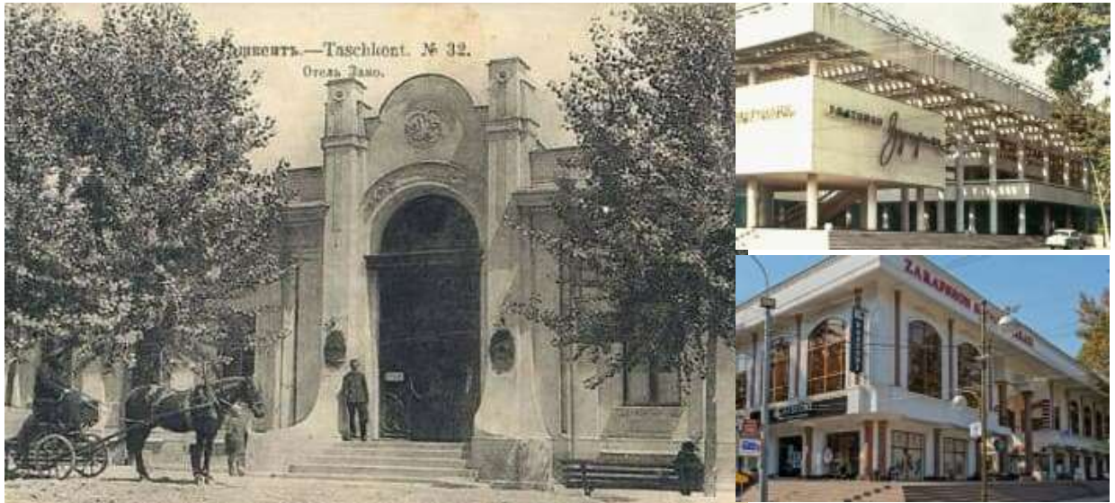
9-расм. «Регина» мехмонхонаси ўрнида қурилган. “Зарафшон” ресторани. (чапда 1916, ўнгда тепада 1981 йил, ўнгда пастда 2019 йил)

Октябрь тўнтариши вақтида Янги шаҳар большевиклар уюштирган ғалаёнлар марказига айланди. 1917 йил 28 мартда Янги шаҳар Ишчи ва солдат депутатлари Тошкент Кенгаши тузилди, Янги шаҳар билан Эски шаҳар расмий маъмурий бирликлар ҳисобланган. 1929 йил Янги шаҳар ва Эски шаҳар кенгашлари Тошкент ишчи, деҳқон, қизил аскарлар деб аталмиш депутатлари шаҳар Кенгашига бирлашди, ягона шаҳар доирасида янги маъмурий бўлиниш жорий қилинди. 1939 йил биринчи марта Янги шаҳар ва Эски шаҳарнинг барча қисмларини ягона шаҳарга бирлаштириш кўзда тутилган Тошкентни реконструкция қилиш Бош плани лойиҳаси тасдиқланган.