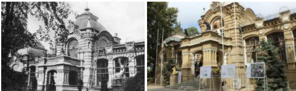
4-расм. Князь Николай Константинович Романов саройи кўринишлари. (чапда ХХ аср боши, ўнгда 2021 йил)

Князь Николай Константинович Романов саройи 1889-1890 йиллар меъморлар А.Л.Бенуа, В.С.Гейнцельман томонидан лойиҳаланган. Князь ўлимидан сўнг Романов сарой музей, 1940-1970 йиллар давомида Республика пионерлар саройи, 1980-йиллар Ўзбекистон антиквар буюмлари ва заргарлик санъати музейи, ХХ аср охирида Ўзбекистон Ташқи ишлар вазирлигининг қабул уйи, 2021-йилга келиб бино реконструкция қилинди ва дастлабки сарой ҳолатига келтирилиб музей сифитида фойдаланишга топширилди (4-расм).