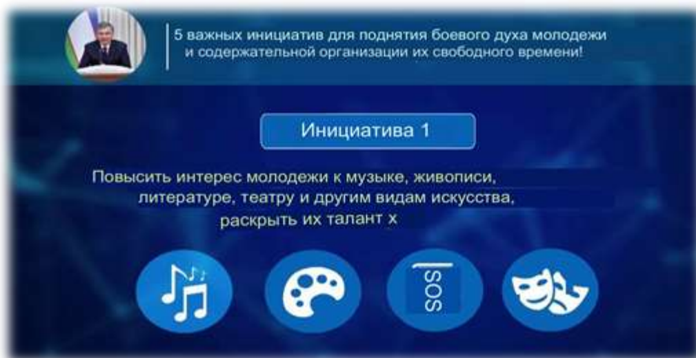
Рис. 1. Фрагмент презентации урока

Известно, что люди хорошо усваивают информацию в основном посредством слуха и зрения. Используя это качество, мы организуем занятия для детей. В связи с этим нам целесообразно проводить практические занятия с применением современной оборудовании и с использованием проекционного оборудования и компьютерной техники.