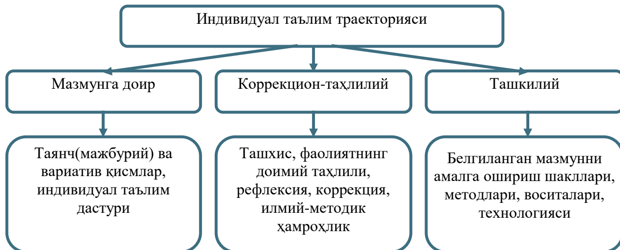
2-расм. Индивидуал таълим траекторияси тузилмаси.

Индивидуал таълим траекториясининг мазмунга доир компоненти малака ошириш таълими мазмунини белгилайди. Таянч қисми Давлат талабларида белгиланган ва таълим-тарбия сифати ҳамда ўқитувчи компетенлигини кўтаришга қаратилган модулларни ўзлаштиришни, вариатив қисми эса педагогнинг касбий эҳтиёжлари ташхиси натижалари ва шахсий қизиқишларига кўра танлови асосида белгиланадиган модулларни ўзлаштиришни назарда тутди. Бу модуллар педагогнинг индивидуал таълим дастурида ўз ифодасини топади.