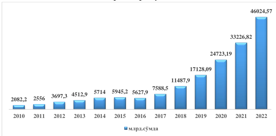
Ўзбекистон Республикаси божхона органлари томонидан 2010-2022 йилларда Давлат бюджетига ўтказилган божхона тўловлари миқдори. млрд.сўмда

Ўтган қисқа вақт мобайнида божхона тўловларининг давлат бюджети даромадлари қисмидаги улуши ҳам ортиб борди, жумладан 2013 йилда бу кўрасткич 17,2 фоизни ташкил қилган бўлса, 2023 йилда 20,1 фоизни ташкил этди.