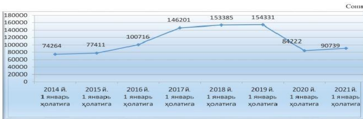
1.3.1-rasm. Respublikada fermer xўjaliklari sonining ўzgarishi.