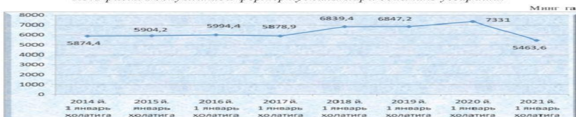
1.3.2-rasm. Respublikada fermer xўjaliklari er maydonlarining ўzgarishi.